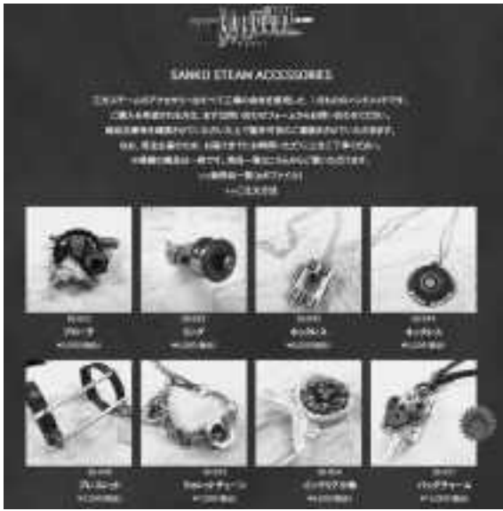
廃材、余材から作られたアクセサリー。すべてが1点もののハンドメイド作品だ

子育てや家庭を持っている女性クリエーターを集めてシェアオフィスを始めた事例を聞き、とても感銘を受けて意見交換の場を持ったそうです。 そして話は進み、三光ダイカスト工業所の工場見学をする運びとなったのですが、訪れた女性クリエーターの一人が「この工場自体がスチームバンクだ！」と発したことがきっかけとな