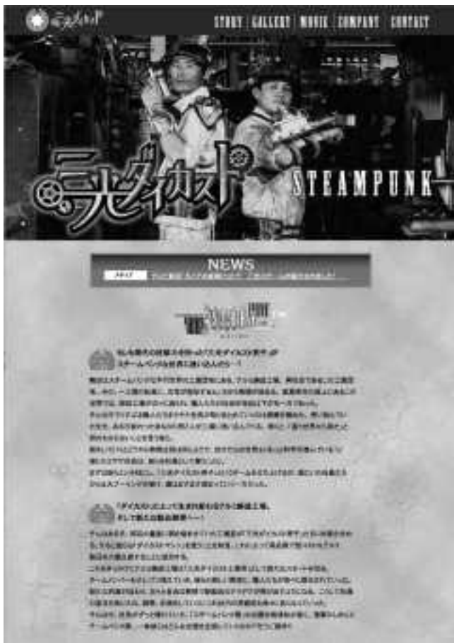
「三光ダイカスト工業所×スチームパンク」ホームページ http://www.sankosteam.com/

身を置き自動車部品とは縁の遠い存在でした。ところが、2代目社長の急な難病から、僅か3カ月で事業承継を決断します。